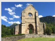
Ruine de l'Abbatiale à St-Jean d'Aulps