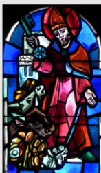
Protecteur des troupeaux