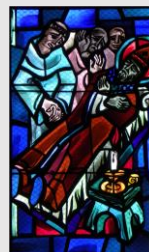
Décès à Aulps le 27 août 1150

« La perfection n'est autre chose qu'un effort constant vers la perfection... Mais n'êtes-vous pas, révérend père, une preuve éclatante de ce que je viens de dire ?