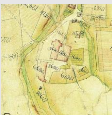
Ancien cadastre de l'Abbaye d'Aulps